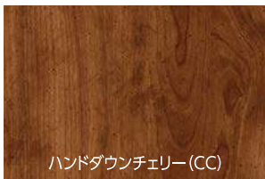
ハンドダウンチェリー(CC)