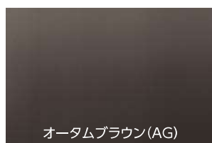
オータムブラウン(AG)

※木目の色柄は本物の木をできるだけ忠実に再現しているため、同じ製品でも部材ごとに色差・濃淡・柄違いが発生することがあります。 ※色によっては天然木の質感を再現するために、樹種特有の樹種痕を入れています。デザインの一部であり、汚れではありません。 ※色が濃いドア本体・ハンドルは、直射日光により高温になることがあります。その際は、直接、手・体を触れないようご注意ください。