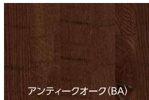
アンティークオーク(BA)