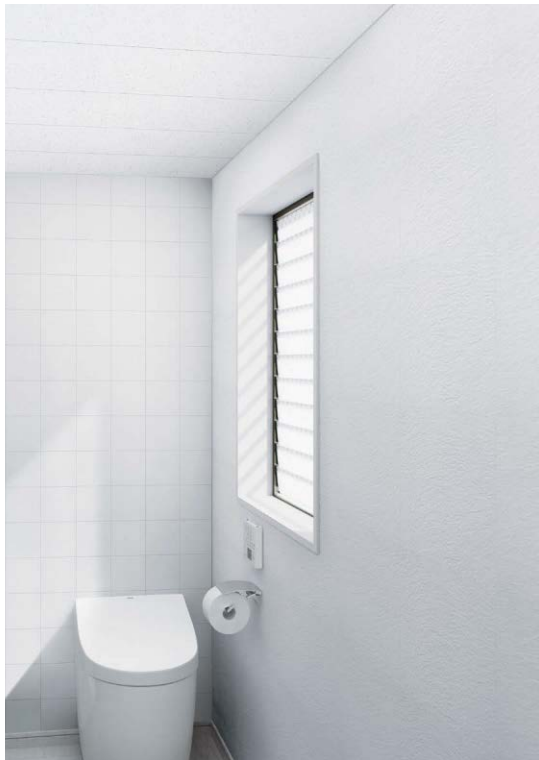
天井材:クリアトーン12SII トイレ天井(00) TA9300 ¥8,140/梱

気になるトイレの臭いを吸着し、消臭します。 一般的なトイレにあわせたサイズで羽目板感覚でスピーディに施工が可能。